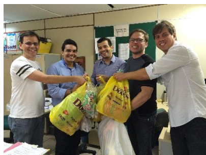
Figura 14 - Entrega de doações na SGP para o Natal Solidário do TJPE (Dez/2015)