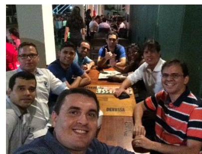
Figura 16 - Confraternização da UNACI (dez/2015)