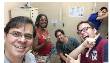
Figura 4 - Equipe trabalhando de manhã mas com muita animação