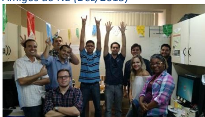
Figura 10 – A animação é garantida