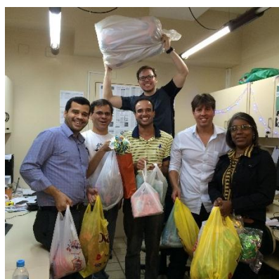
Figura 13 - Equipe com as doações do Natal Solidário do TJPE (Dez/2015)