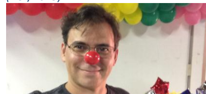
Figura 19 – E que venha 2016!