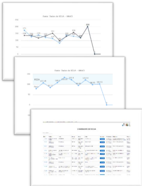
Figura 2-Telas da interface com SCUA feita por Rodrigo Medeiros (UNACI)

Era 100 por cento Mas com muito suor Fizemos até melhor Um ótimo rendimento O chefe fará o pagamento Que o gerente vai ajudar Até o diretor vai colaborar Tá vendo, Rafael?