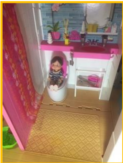
Dar descarga após usar o banheiro