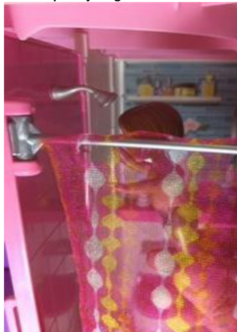
Não desperdiçar água durante o banho