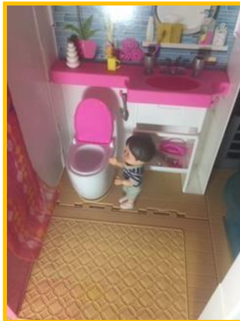
Fechar a tampa do vaso