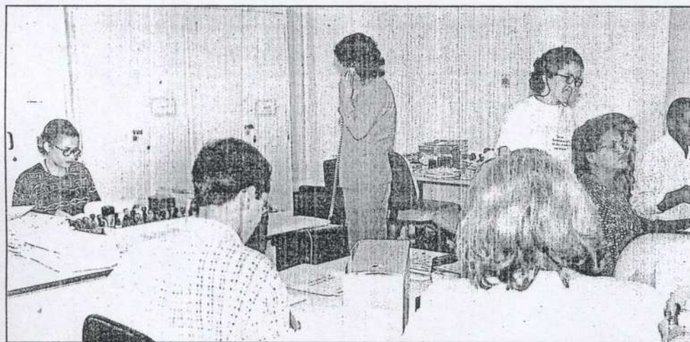
Diretoria Cível terá melhor ambiente de trabalho para atendimento ao público