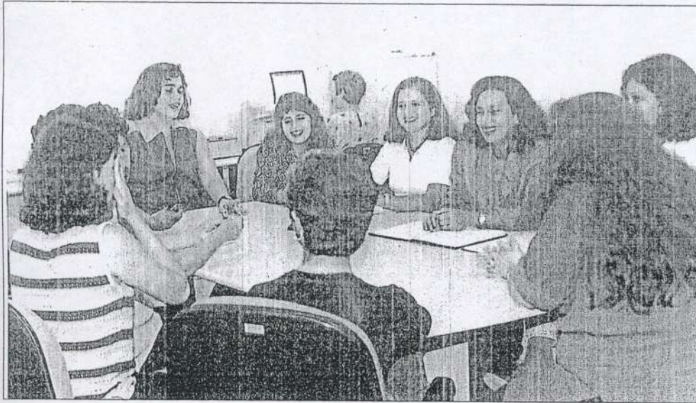
O aconselhamento psicológico torna menos tenso o momento da separação