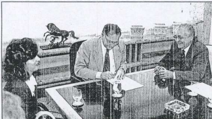
Secretários municipais estiveram presentes à assinatura do acordo entre TJPE e PCR

Pelo acordo de cooperação técnica, administrativa, financeira e de apoio institucional,