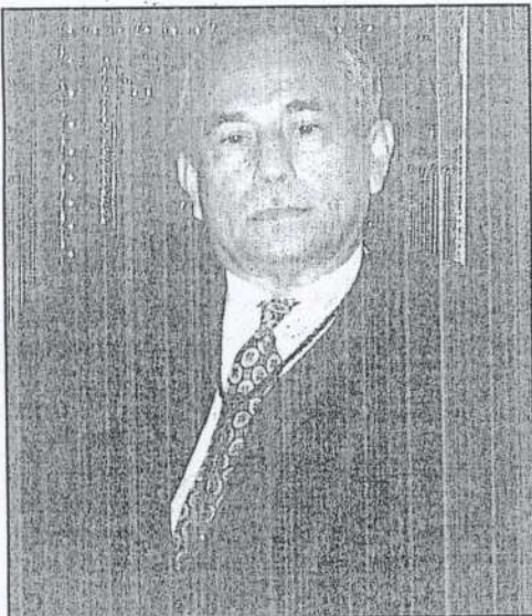
Nildo Nery é o novo presidente do Tribunal de Justiça

co para juiz. Foi promovido a desembargador em 1990, tendo sido presidente da 2ª Câmara Criminal, presidente da Seção Criminal e, no biênio 1994/1995, ocupou o cargo de vice-presidente do Tribunal de Justiça.