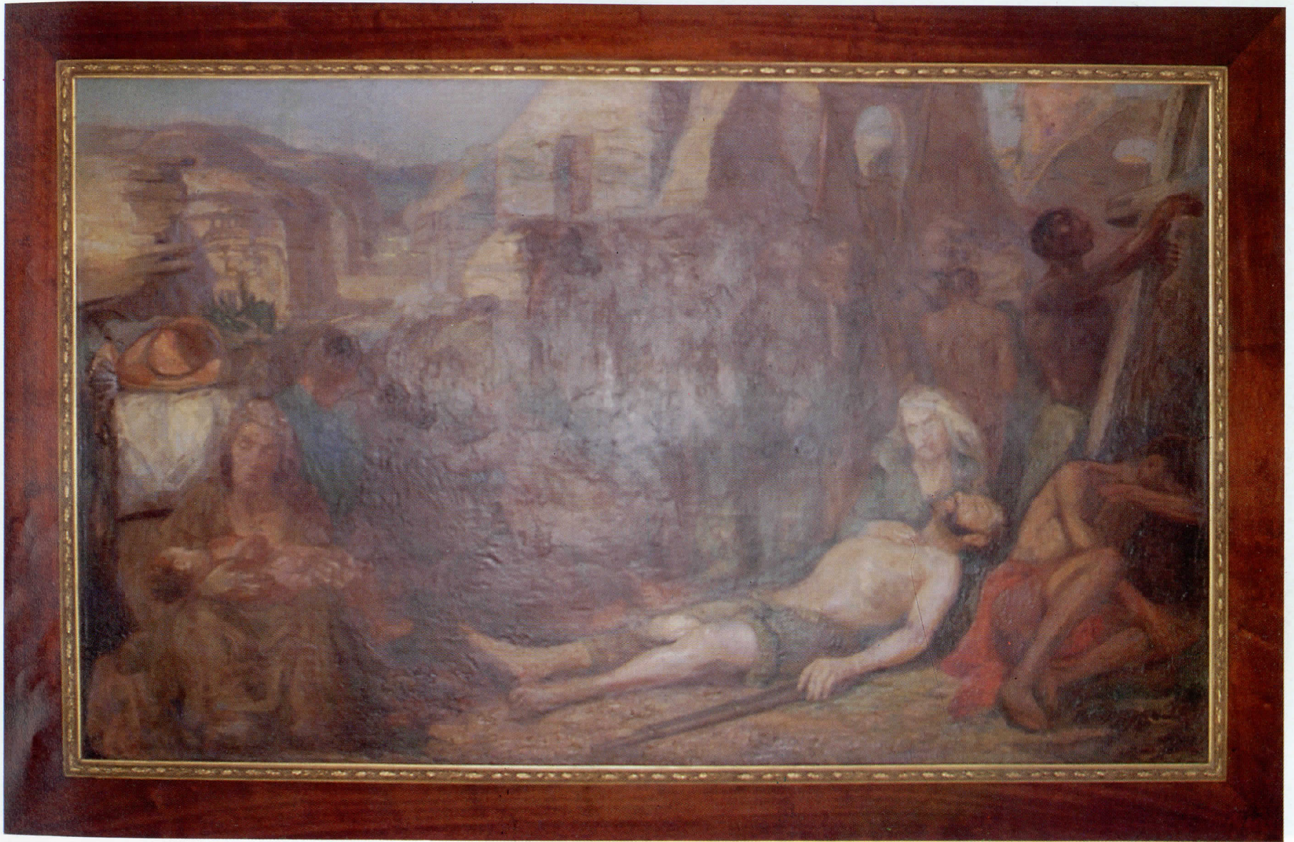
Tela "Os últimos fanáticos de Canudos" de Murillo La Greca