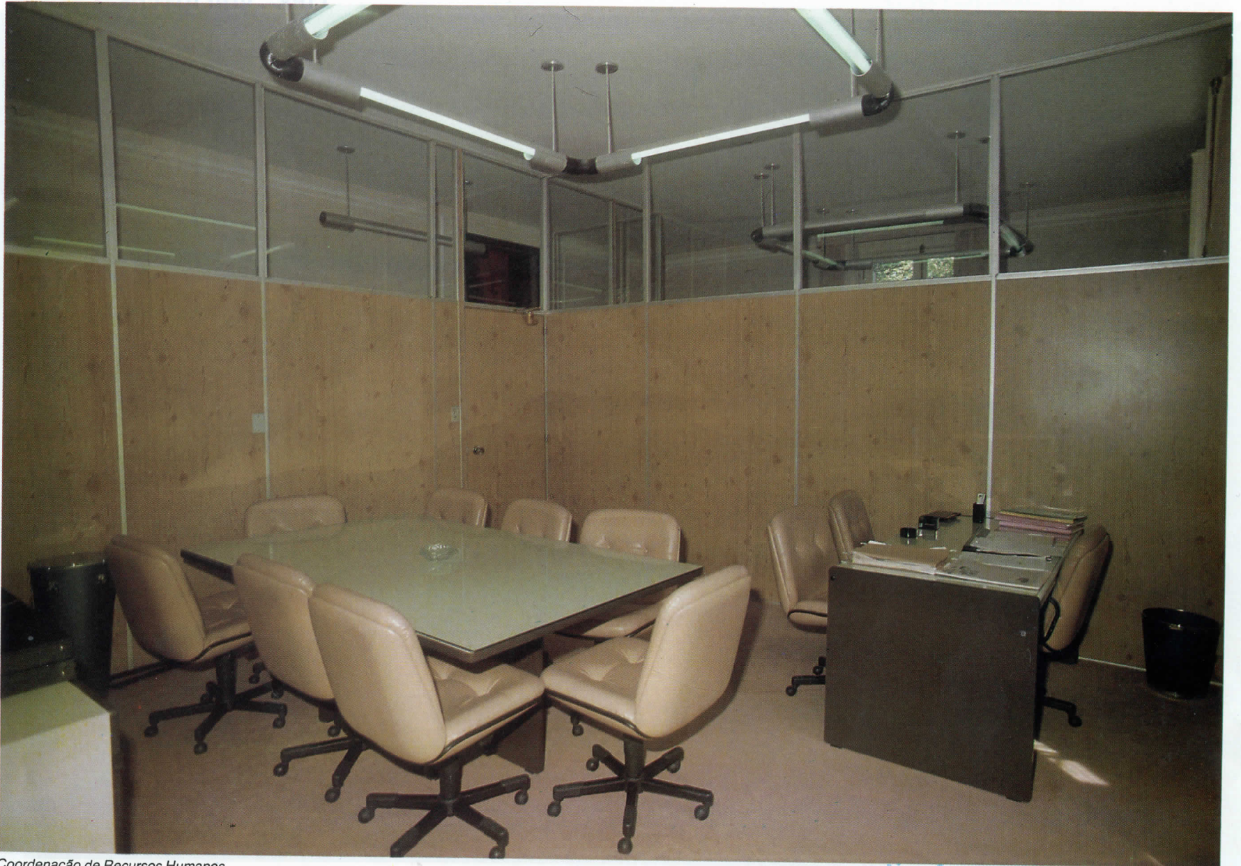
Coordenação de Recursos Humanos