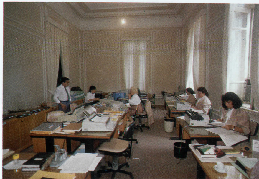
Departamento Administrativo e Pessoal

Outra importante reforma foi a do prédio nº 12 da Rua Belmiro Correia, na Encruzilhada, para a implantação do Juizado de Pequenas Causas.