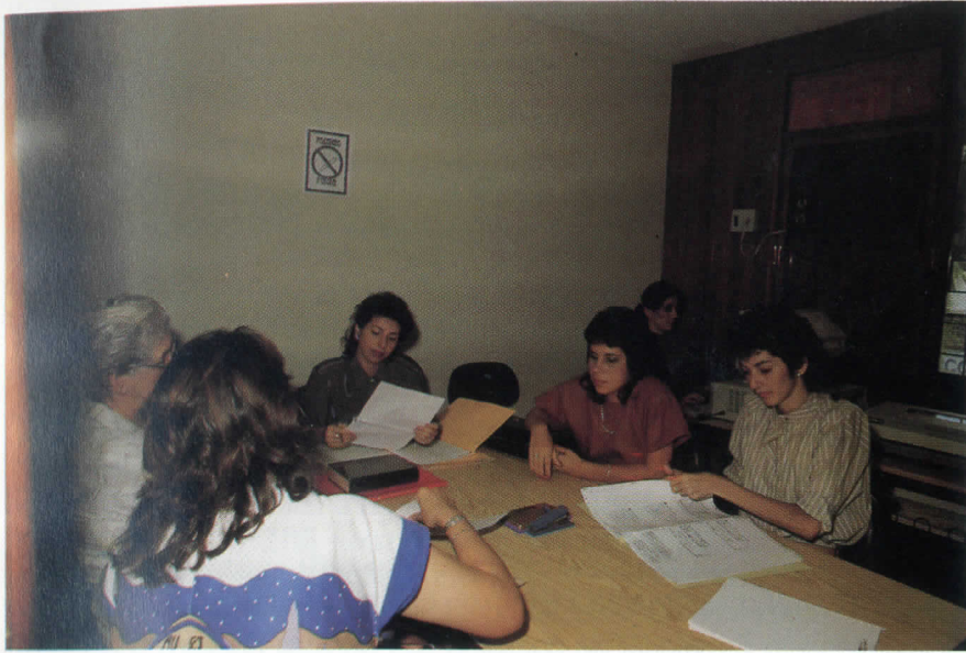
1º Juizado Especial de Pequenas Causas