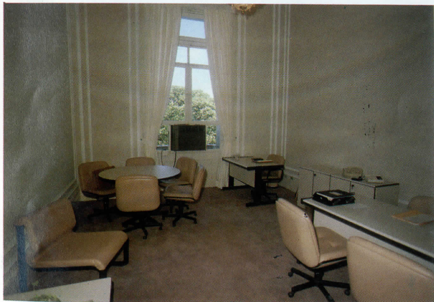
Gabinete da Secretaria Geral

Empreendidas reformas ainda nas salas que abrigam a Chefia de Gabinete da Presidência, Secretaria do Tribunal, Salão do Júri e Salão Nobre, neste último inclusive, com a impermeabilização do patamar de projeção, pintura de toda a área, aplicação de verniz, limpeza das ferragens, mu-