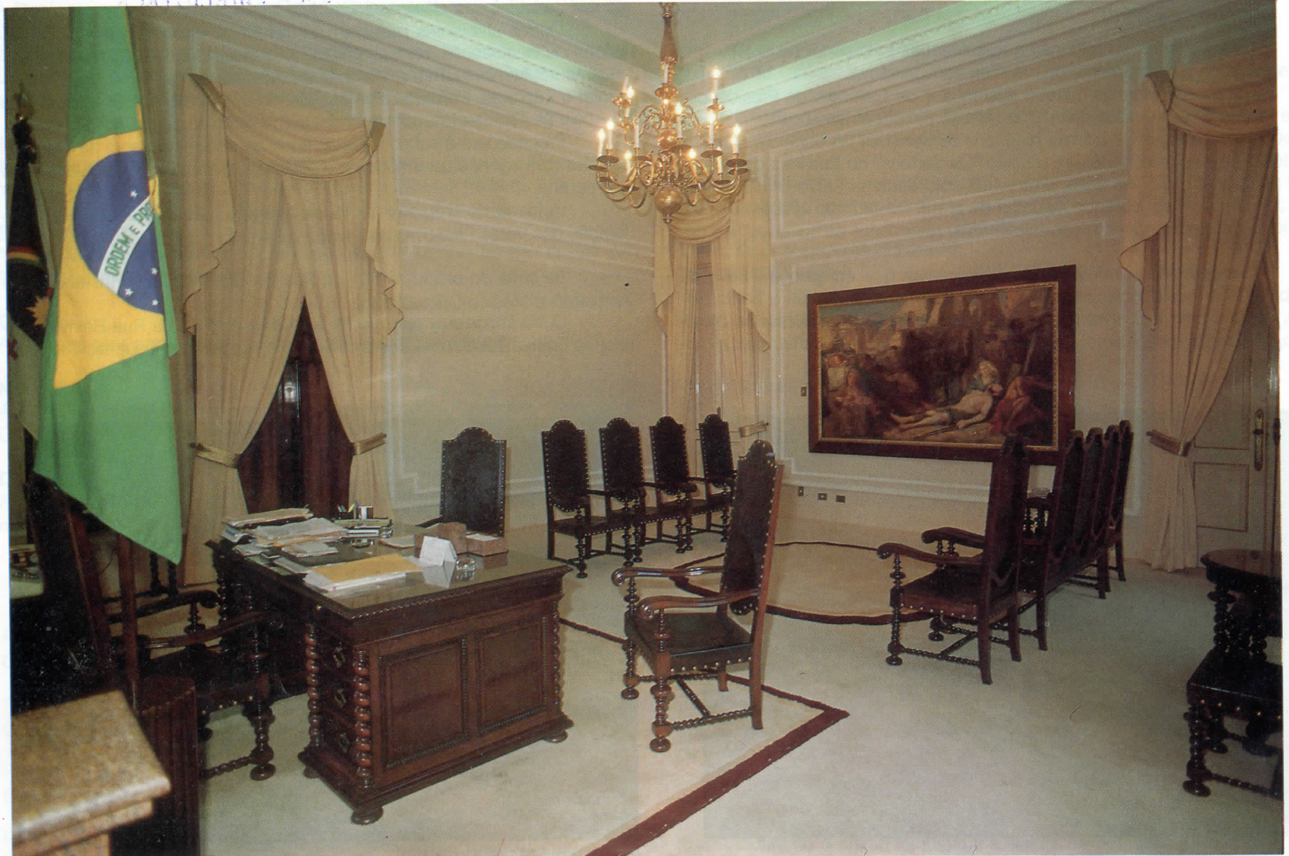
Gabinete da Presidência