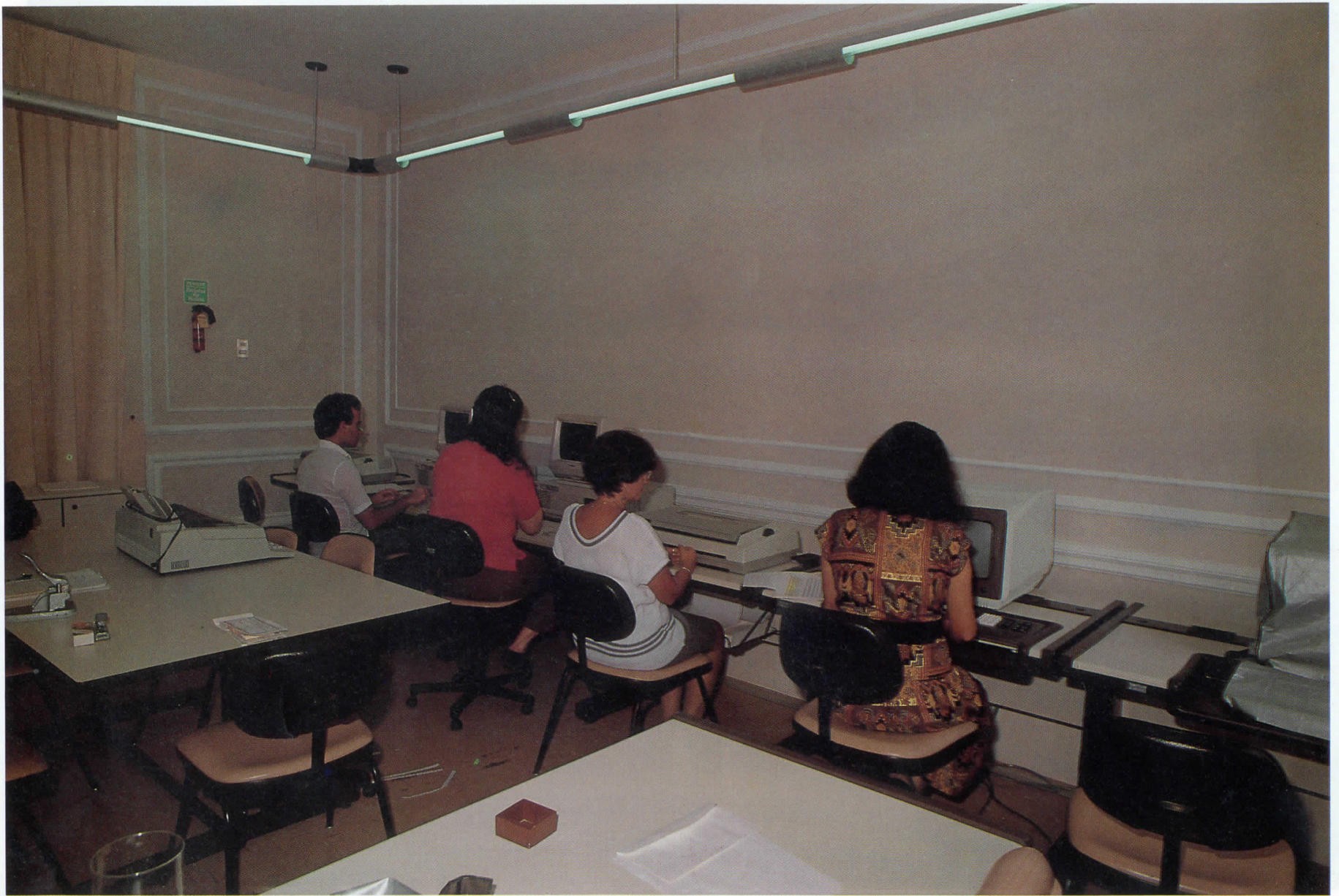
Núcleo de Organização e Sistemas