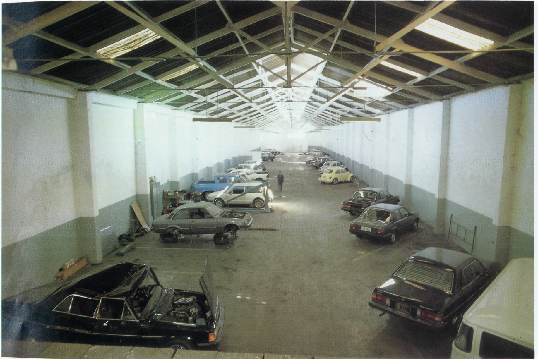
Garagem do TJPE