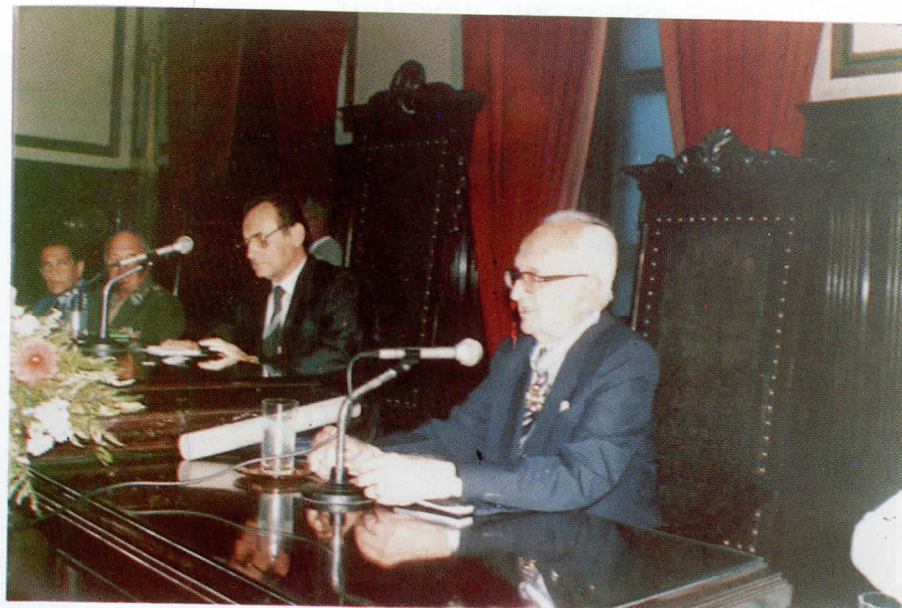
Palestra do Acadêmico Barbosa Lima Sobrinho durante a solenidade do 167º aniversário do TJPE