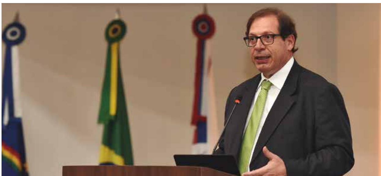
Ministro Luís Felipe Salomão durante simpósio na ESMAPE

Na ocasião, o ministro Luís Felipe Salomão recebeu a Medalha do Mérito Judiciário Desembargador Joaquim Nunes Machado, oferecida pelo TJPE, e a Medalha do Mérito Juiz Aluiz Tenório de Brito, honraria concedida pela Esmape.