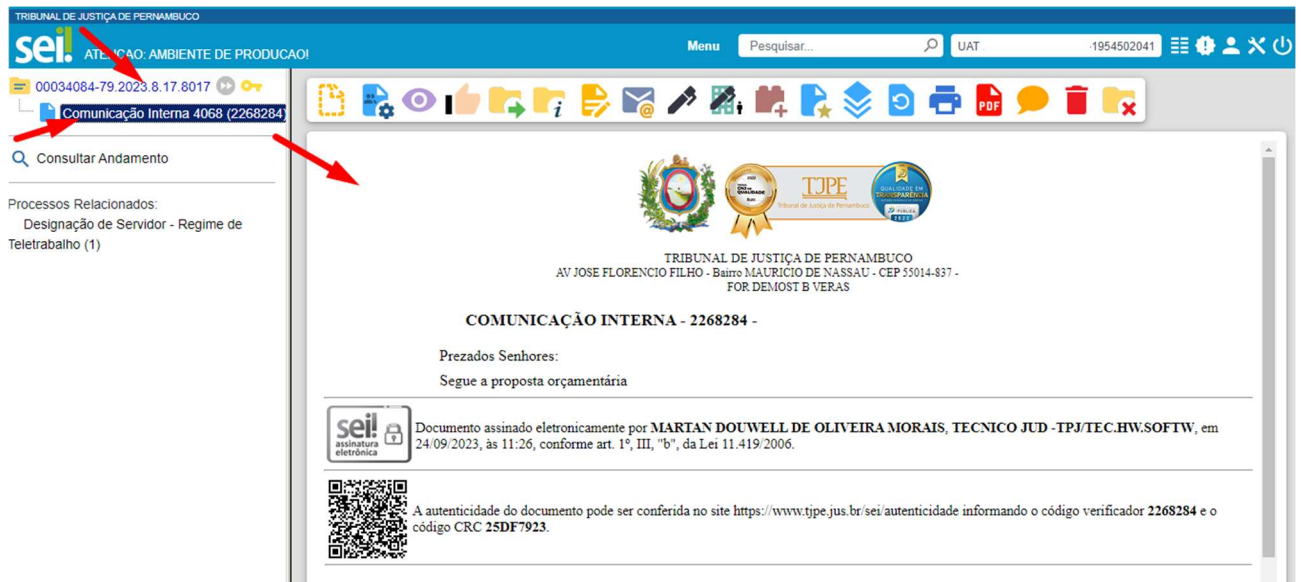
Figura 3 – Conteúdo do documento

Para acessar o conteúdo do documento, clique sobre o número do processo e, em seguida, sobre o número do documento.