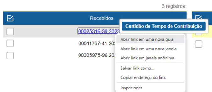
Figura 2 – Opção de abertura do processo

Na tela Controle de Processos, ao clicar com o botão direito do mouse sobre o processo, o usuário poderá optar por abri-lo em nova guia ou janela.