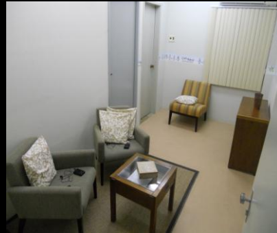
Sala de audiência da criança