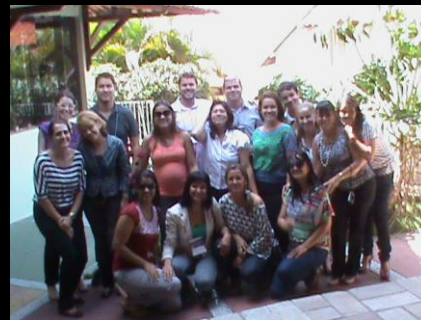
Equipe de ministrantes e servidores do TJPE que realizaram Treinamento em Depoimento Acolhedor, Caruaru, setembro, 2011.