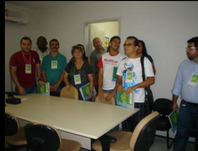
CICA, setembro 2010

- 04 Encontros de divulgação do Projeto de Depoimento Acolhedor para alunos da rede pública de educação. Esta ação foi realizada em parceria com a Secretaria de Educação do Município e o Projeto do TJPE “Escola Legal”. Integra as atividades do Projeto “Escola Acolhedora” da Central de Depoimento Acolhedor, que visa a promoção de ações de divulgação e instalação dos procedimentos judiciais de antecipação de provas, previstos pela Portaria 47/10, cujas denúncias sejam originárias da rede estadual de ensino, abrangidas pelo Projeto Escola Legal, envolvendo a violência de natureza física ou sexual praticada contra o corpo discente infantojuvenil.