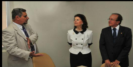
Central de Depoimento Acolhedor, fevereiro, 2010

- Visita da Rainha Silvia Renate Sommerlath , da Suécia, fundadora da World Childhood Foundation, à solenidade de inauguração da Central de Depoimento Acolhedor;