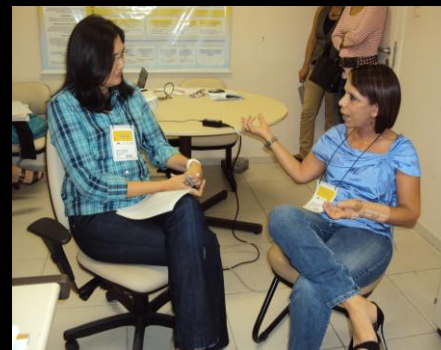
Equipe de juízes e ministrantes do Treinamento em Depoimento Acolhedor para Magistrados, CICA, novembro, 2011