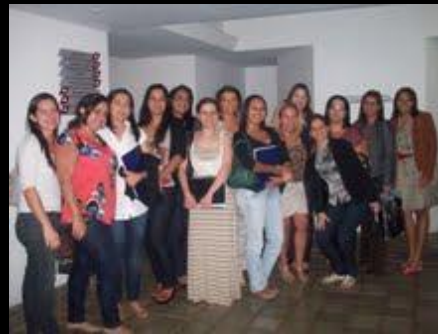
Equipe de ministrantes e servidores do TJPE, por ocasião do Treinamento em Depoimento Petrolina, junho, 2011

- 01 Treinamento em Depoimento Acolhedor para 11 servidores da Comarca de Caruaru e 13 servidores da Comarca de Petrolina, visando habilitá-los em audiência especial, quando da instalação do Projeto nas respectivas Comarcas. A ação foi realizada através de parceria com a Escola Superior de Magistratura de Pernambuco (ESMAPE);