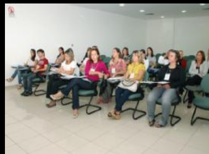
Equipe de cursistas e ministrantes do Treinamento em Depoimento Acolhedor, TJPB, janeiro, 2011

- participação no I Encontro Nacional de Experiências de Tomada de Depoimento Especial de Crianças e Adolescentes do Judiciário Brasileiro, promovido pelo Conselho Nacional de Justiça (CNJ) e a Childhood-Brasil, em Brasília, no período de 18 a 20 de maio de 2011. O evento foi uma iniciativa do Conselho Nacional de Justiça, no seu esforço de engajar a Justiça Brasileira num processo de mudança cultural do paradigma de oitiva de crianças e adolescentes. Neste sentido, a organização vem apoiando a realização de estudos e pesquisas, promovendo eventos e