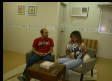
Treinamento - CICA, fevereiro e junho, 2010

- 01 Curso de Capacitação no Enfrentamento à Violência Intrafamiliar e Doméstica Contra Crianças e Adolescentes, com ênfase no abuso sexual, promovido pelo Núcleo de Estudo da Violência e Promoção à Saúde (NEVUPE), da Universidade de Pernambuco (UPE), para integrantes do Setor de Entrevistadores da Central de Depoimento Acolhedor e Conselheiros Tutelares;