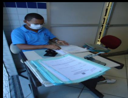
Instalações provisórias do Projeto no CICA, Recife, 2011