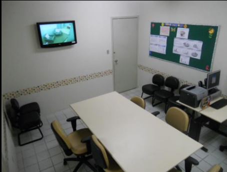
Sala de audiência do Juiz