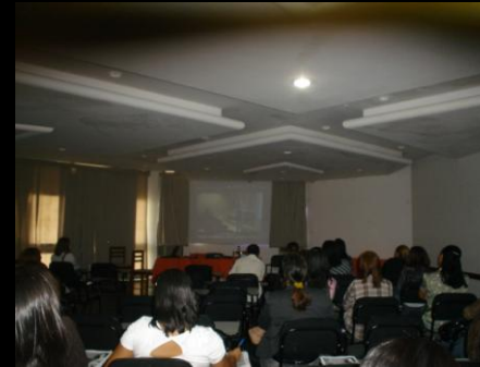
Seminário em Depoimento Acolhedor para servidores e representantes da rede de apoio, Petrolina, junho, 2011