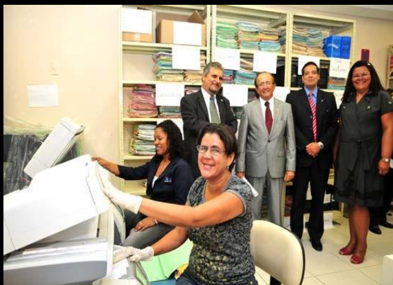
Visita do Exmo. Sr. Presidente do TJPE às instalações do Projeto, no CICA, março, 2011