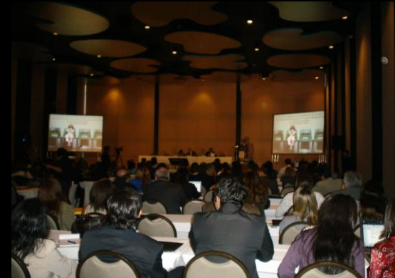
Solenidade de abertura,Salão Nobre do Supremo Tribunal Federal - Brasília/DF, maio, 2011

“O Depoimento Especial e o Sistema de Justiça Brasileiro”, Brasília- DF, maio 2011