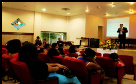
Palestra no auditório Oscar Pereira, outubro, 2010