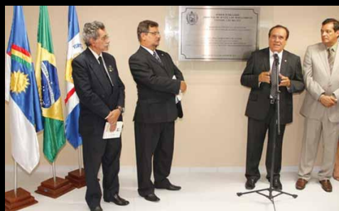
Solenidade de inauguração do Arquivo Geral da Infância e Juventude-Edifício Armando de Barros Figueirêdo, CICA, 26,janeiro,2012