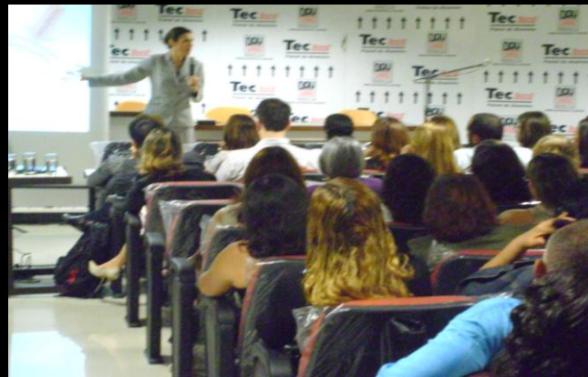
Seminário e aula de inauguração do Curso de Entrevista Investigativa, Fórum Rodolfo Aureliano, Recife, junho de 2010