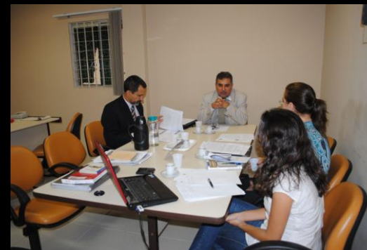
Reunião de apresentação da proposta do Programa Acolher, junto a representantes da Secretaria de Saúde, Secretaria da Criança e Juventude do Estado, CICA, setembro, 2011.