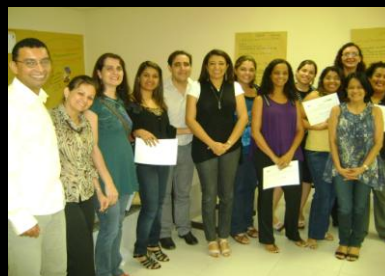
Alunos do Curso - Auditório do CICA, janeiro, 2010

- 01 Curso de Capacitação no Enfrentamento à Violência Intrafamiliar e Doméstica Contra Crianças e Adolescentes, com ênfase no abuso sexual, promovido pelo Núcleo de Estudo da Violência e Promoção à Saúde (NEVUPE), da Universidade de Pernambuco (UPE), para integrantes do Setor de Entrevistadores da Central de Depoimento Acolhedor e Conselheiros Tutelares;