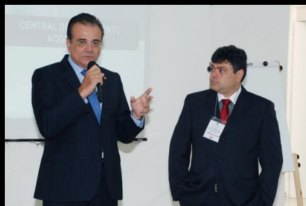
Solenidade de abertura do Treinamento no TJPB. O desembargador Saulo Benevides, representou o presidente do TJPB, na abertura do evento. TJPB, janeiro, 2011.