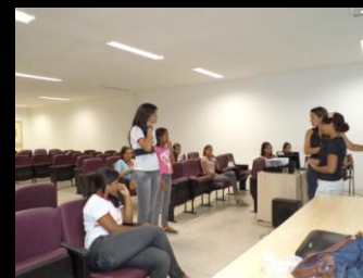
Centro Paulo Freire, Recife, novembro, 2011