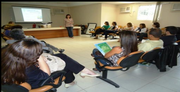
Treinamento de servidores, no CICA, setembro/11

A estrutura física do Arquivo Geral da Infância e Juventude constitui-se de cerca de 200m 2 de área coberta, com capacidade para acomodar 101 estantes. No espaço funciona, ainda, o serviço de digitalização dos processos de adoção e correlatos, oriundos das Comarcas de todo o estado, os quais, depois de digitalizados, permanecerão no local, como parte integrante de seu acervo. O acesso às informações processuais poderá ocorrer por servidor devidamente habilitado, através da internet, serem impressas, ou ainda, salvas em mídia.