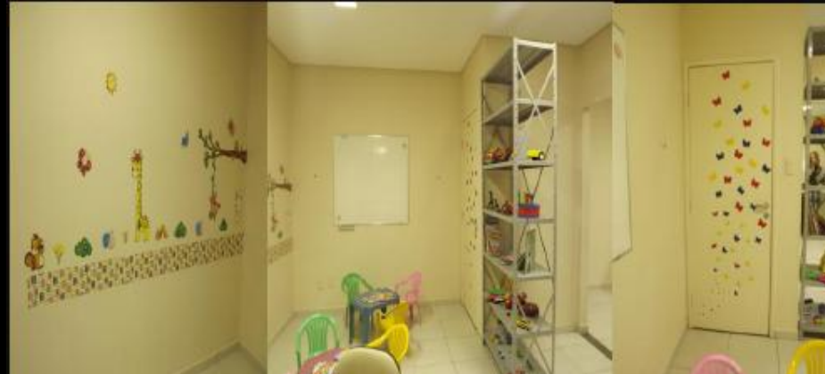
Sala do Projeto Biblioterapia, CICA, janeiro, 2012.

- Projeto Biblioterapia – ação da Biblioteca do Centro Integrado da Criança e do Adolescente - CICA, com o apoio da Fundação Joaquim Nabuco. Encontra-se em fase de implementação. Objetiva oferecer contação de histórias e atividades lúdicas às crianças e adolescentes vítimas de violência e seus familiares, atendidos pela Central de Depoimento Acolhedor.