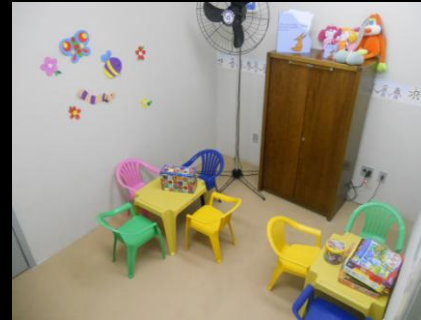
sala de acolhimento da criança