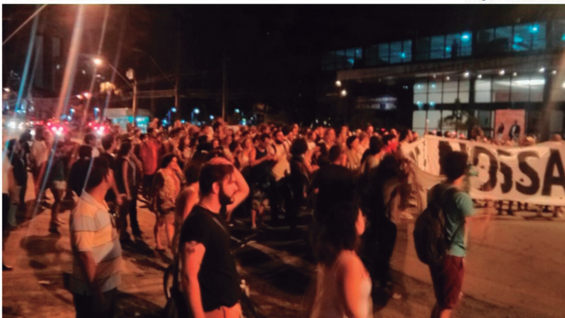
Participantes fecharam a avenida Conselheiro Aguiar (foto). Em seguida, seguiram pela avenida Domingos Ferreira

Integrantes do Movimento Ocupe Estelita realizam uma passeata na Zona Sul do Recife desde o início da noite desta quarta-feira (13). A concentração ocorreu por volta das 16h30, na praça Cidade do Porto, no bairro de Boa Viagem. Em seguida, os manifestantes saíram pela avenida Agamenon Magalhães. A Companhia de Trânsito e Transporte Urbano (CTTU) realizou desvios no tráfego.