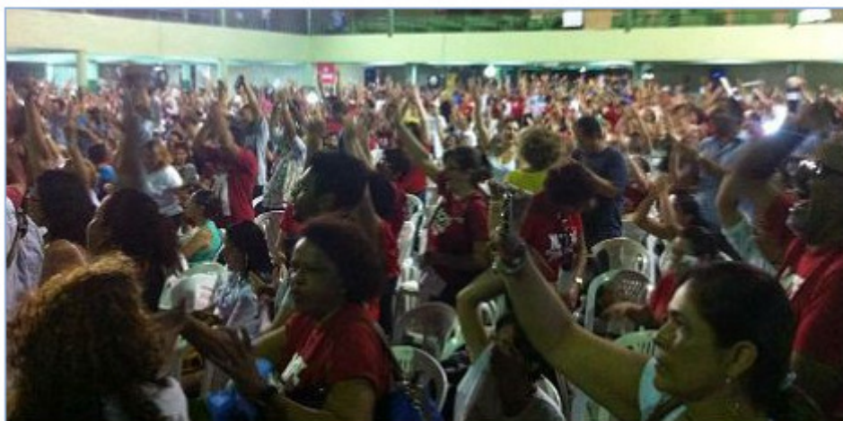
A assembleia teve adesão de aproximadamente 2 mil professores

Nesta terça-feira, representantes da categoria devem se reunir com o governo