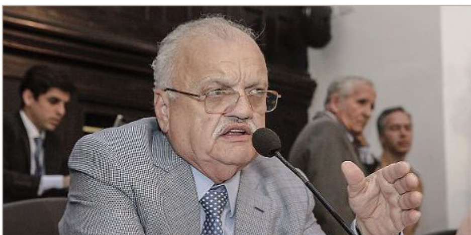
OAB impetra recurso contra decisão do TJPE que derrubou liminar da 1ª instância e reconduziu Guilherme Uchoa à presidência da Mesa

No último dia do prazo, Ordem cumpre promessa de contestar medida do presidente Frederico Neves que derrubou suspensão da reeleição no Legislativo