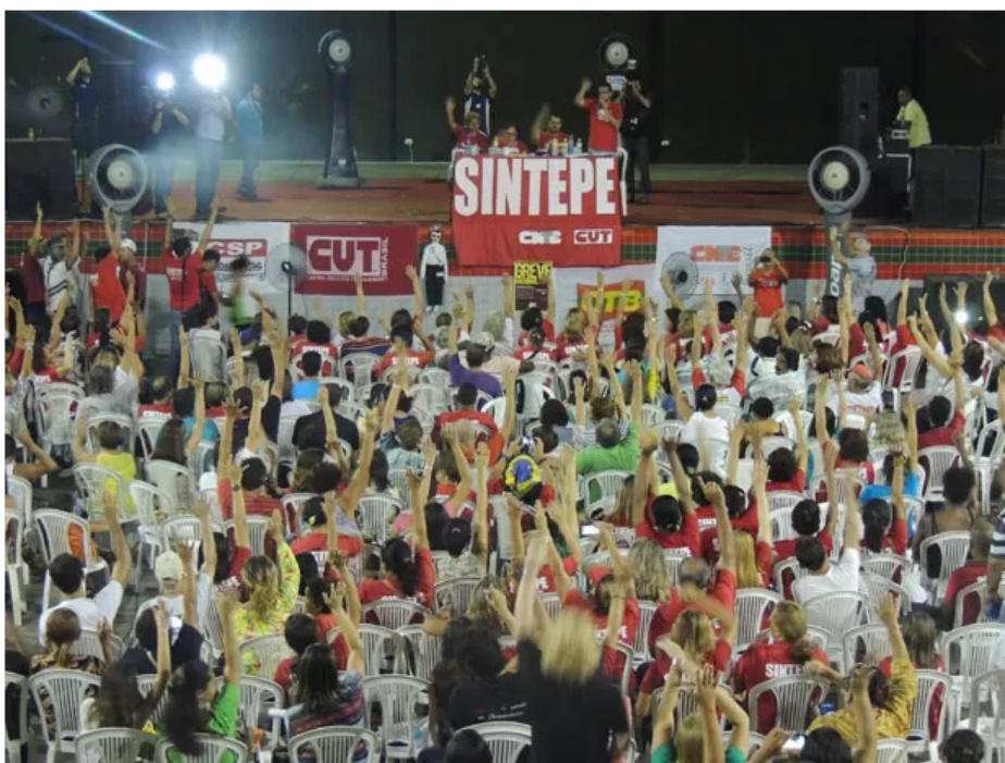
Em nova assembleia realizada nesta segunda, Sintepe decidiu continuar mobilização e manter greve, que já dura 17 dias

Paralisação já dura 17 dias; categoria quer aumento de 13,03% para todos. Governo limitou esse percentual de reajuste a quem tem ensino médio.