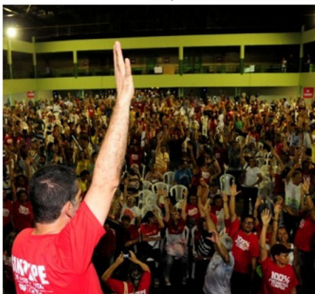
Decisão foi tomada em assembleia realizada à tarde

Em assembleia realizada na tarde desta segunda-feira (27), no Clube Português, no Recife, os professores da rede estadual de ensino decidiram manter a greve deflagrada no último dia 10. Durante o encontro, representantes da categoria justificaram a decisão afirmando que não houve avanços nas negociações com o Governo do Estado.