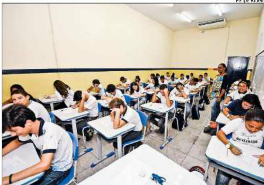
AULAS devem continuar suspensas até a próxima assembleia, segunda-feira