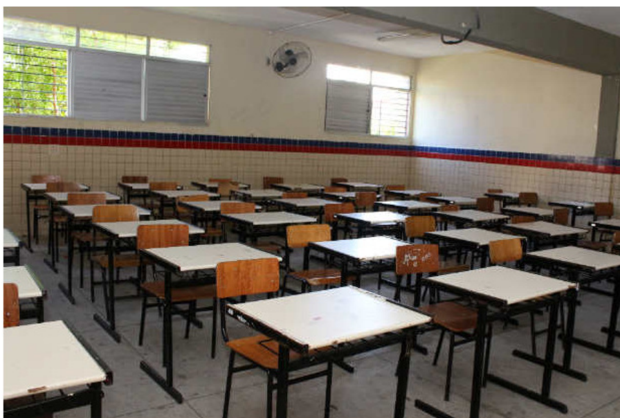
A greve dos professores foi deflagrada no último dia 10 e deixa escolas fechadas há 12 dias.

Levantamento realizado pela Secretaria Estadual de Educação aponta que 57% das escolas não paralisaram as atividades