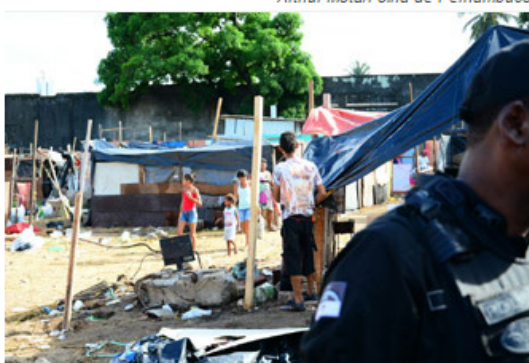
Reintegração de posse ocorria pacífica até ser percebida a ausência de um oficial de justiça

O clima esquentou durante a reintegração de posse de um terreno localizado em Afogados, Zona Oeste do Recife, na manhã desta quarta-feira (22). Cerca de 500 famílias estavam sendo retiradas da comunidade Olho D'Água com ajuda de 20 caminhões, quando um dos líderes do Movimento dos Trabalhadores Sem Teto (MTST) anunciou que os moradores não deveriam mais colocar seus pertences nos veículos, pois a ação não contava com a presença de um representante do Ministério Público.