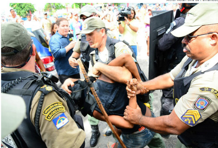
Um homem foi detido pelos policiais durante o tumulto

Local pertence à União e está concedido a uma empresa