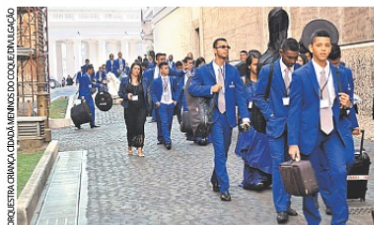
Jovens mostraram que quem tem talento vai a Roma

Grupo formado por meninos e meninas do Coque se apresentou para o papa no Vaticano. No dia 4, eles tocam para o premiê de Portugal