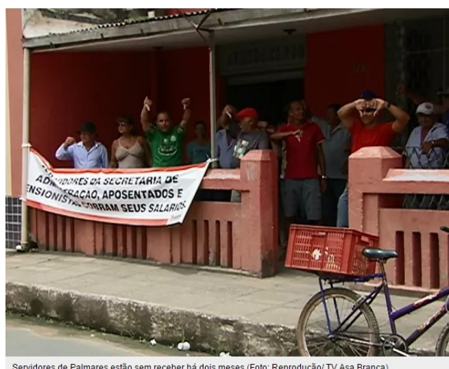
Servidores de Palmares estão sem receber há dois meses

Aposentados, pensionistas e alguns ativos estão sem receber há dois meses. Débito somariam mais de R$ 2 milhões, segundo representante do Sinsempal.