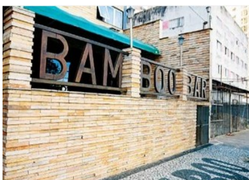
Vítima foi espancada até a morte dentro do bar

Estrangeiros foram apontados como autores de homicídio em fevereiro de 2008