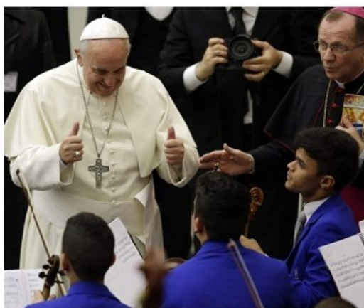
Papa acompanhou apresentação com 400 pessoas

Meninos do Coque tocaram várias composições de Bach e emocionaram o Pontífice