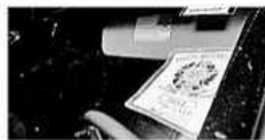
ACIDENTE Logomarca no vidro confirma profissão da motorista

e este bateu em um Fiat Uno que estava adiante. Não havia ninguém dentro dos veículos quando o inci-