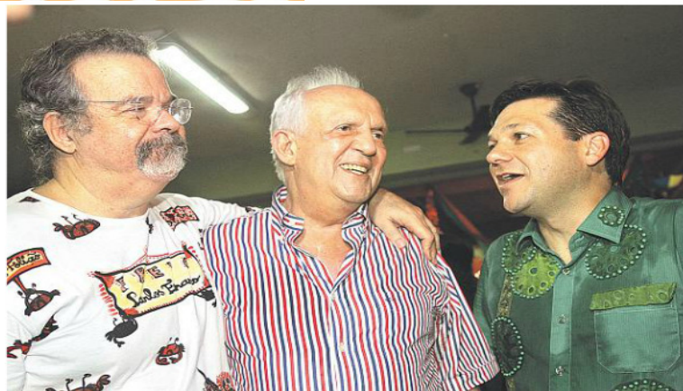
Raul Jungmann, Jarbas Vasconcelos e Geraldo Julio