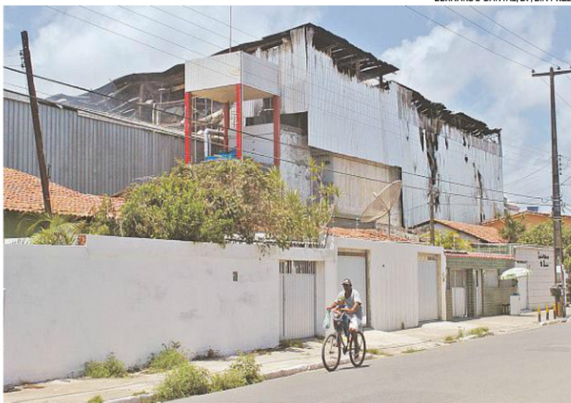
Acidente fatal aconteceu na Rua das Moças, no Arruda, onde não há ciclovia