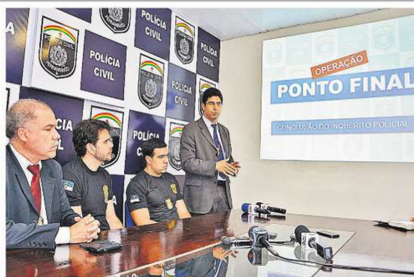
INQUÉRITO Provas apresentadas comprovam envolvimento dos vereadores, diz a Polícia Civil