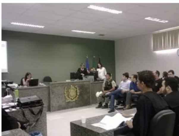
'Debate é a parte mais esperada', diz juíza.

No último dia do julgamento, está previsto debate entre acusação e defesa. 'Sessão tem ocorrido dentro do que foi programado', diz juíza.