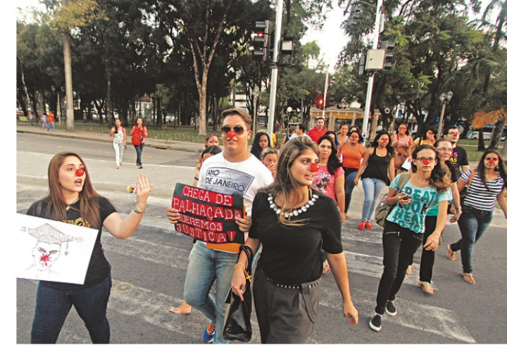
Os estudantes, que se encontraram ontem, estão apreensivos com possibilidade de não receber dinheiro de volta