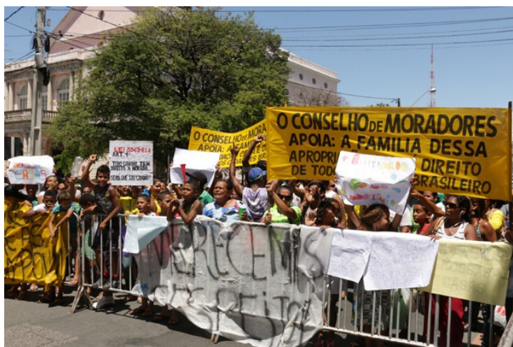
Moradores argumentam que comunidade foi criada há mais de 40 anos, e possui CEP, reservatório de água, casa de saúde e serviços regularizados de água e energia

Grupo protestou contra mandado que determina desocupação da comunidade na manhã desta segunda. Eles foram recebidos pelo secretário executivo da Casa Civil