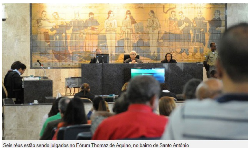
Seis réus estão sendo julgados no Fórum Thomaz de Aquino, no bairro de Santo Antônio

Crime ocorreu em 2011. Suspeita é de que morte tenha sido parte de um ritual