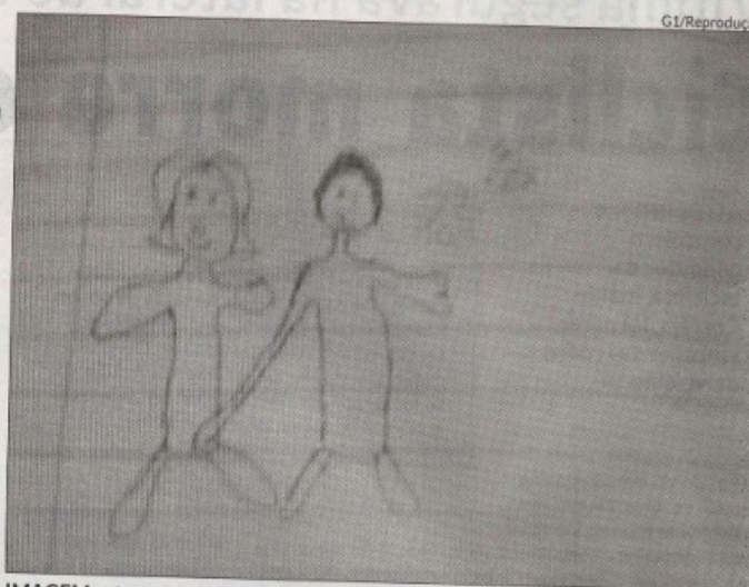
IMAGEM retrata um homem acariciando as partes íntimas de uma menina