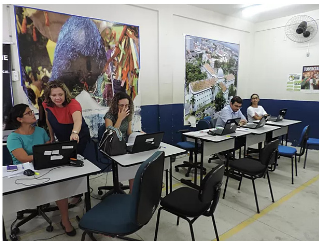
Defensores públicos vão atender, em esquema de força-tarefa, presos do Complexo do Curado.

Objetivo é dar assistência jurídica aos 7 mil presos até o dia 13 de março. Conjunto de presídios teve série de rebeliões no começo deste ano.