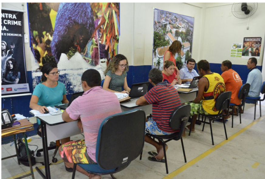
Mutirão de advogados tem o objetivo de adiantar trabalho que normalmente é feito em cerca de oito meses

Ação contou com 48 defensores de vários estados para acelerar processos