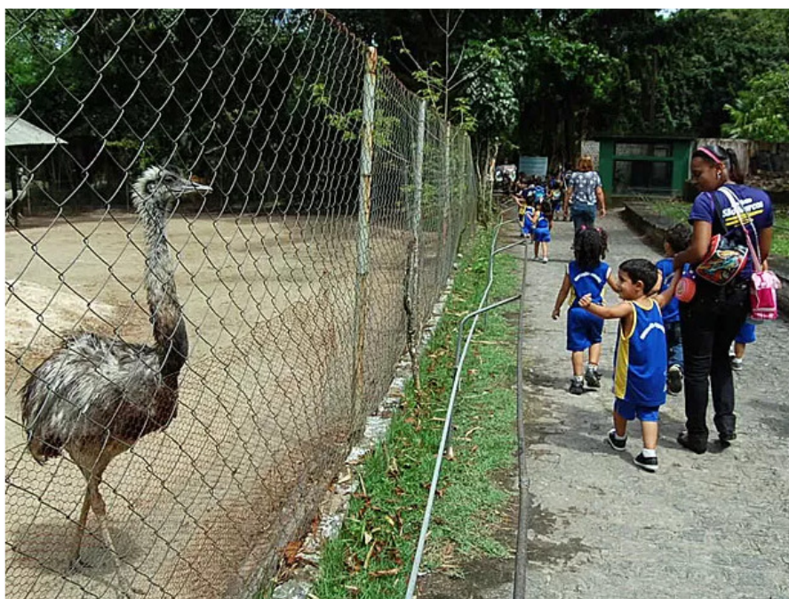
Para MPPE, recintos dos animais devem ficar mais parecidos com o habitat real deles

MPPE entrou com ação civil pública cobrando início das obras no parque. Infraestrutura precária foi alvo de reportagem da TV Globo Nordeste.