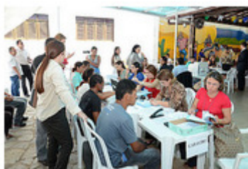
TJPE Tribunal de Pernambuco promove 4º Mutirão DPVAT de Caruaru