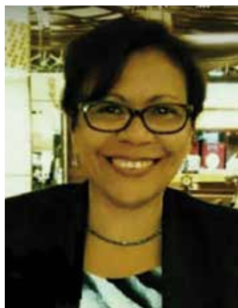
Sineide Barros Canuto Procuradora de Justiça do Ministério Público de Pernambuco