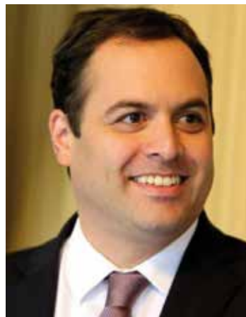
Eriberto Medeiros Presidente da Assembleia Legislativa de Pernambuco