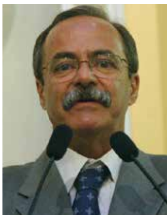
Pedro Eurico de Barros e Silva Secretário de Justiça do Estado de Pernambuco