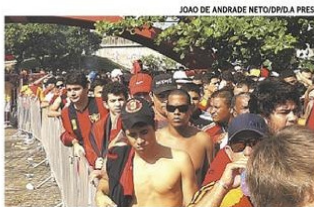
Torcedores enfrentaram filas para entrar na ilha

Muitos torcedores sofreram com a ação de cambistas, ontem, na Ilha do Retiro. Não foram poucos as denúncias da ação do lado de fora e até dentro da sede rubro-negra. Esses com bilhetes de sócios. Sem ingressos, algumas pessoas voltaram para casa. Na mão dos atravessadores, cada bilhete de arquibancada saía por R$ 60, o dobro do preço cobrado nas bilheteria. No entanto, após a partida, nenhum cambista havia sido levado para a unidade do Juizado do