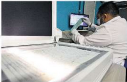
MINUCIOSO Pesquisadores organizam e digitalizam os laudos que se tornarão públicos

das por trás do corpo e com um laço no pescoço. O laudo do IML relativo ao caso traz uma profusão de fotos da vítima, as primeiras a vir a público desde o trágico caso. São oito fotografias, todas nas revelações originais. As imagens dão rosto à Menina sem Nome e a mostram ainda amarrada, sobre a mesa da perícia. Os detalhes das marcas no pescoço e na face também são mostrados nas fotos. A expressão de desolação no rosto da menina denuncia o sofrimento provocado pelo agressor antes de sua morte.