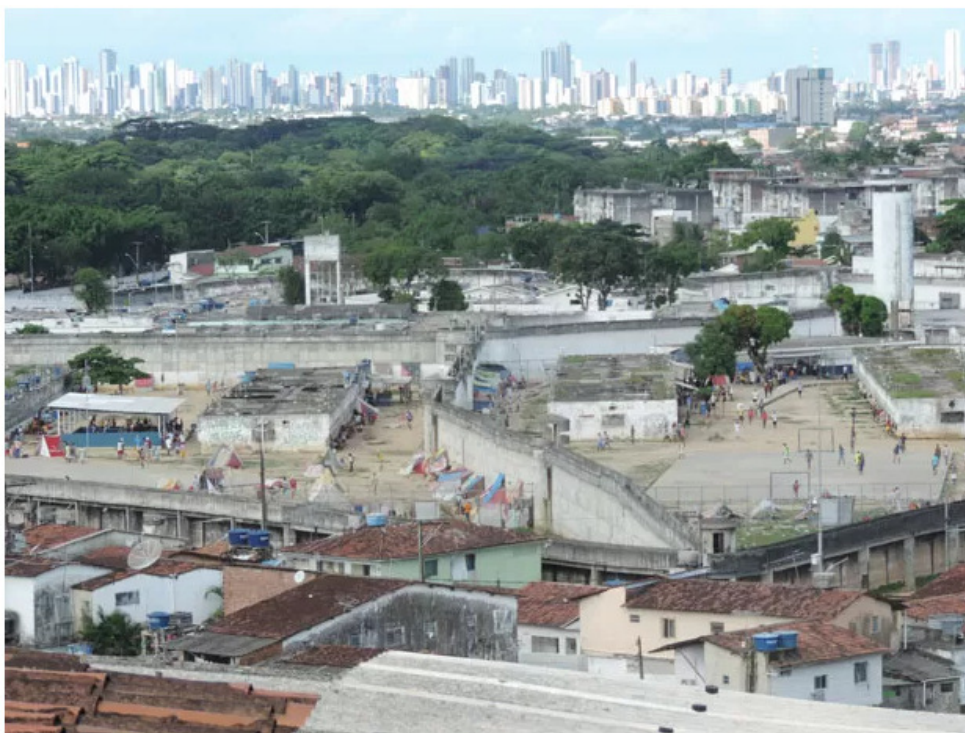
Famílias de presos do Complexo Prisional do Curado afirmam ver pouca diferença dois meses após tumultos

Decreto de emergência no sistema penitenciário de PE completou 2 meses. Parentes denunciam lentidão na análise de processos e falhas na estrutura.