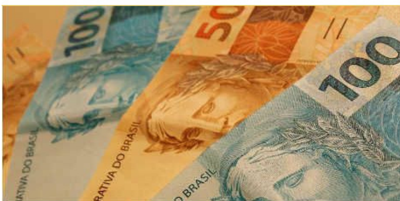
Meta é resgatar R$ 100 milhões

Dívidas com governo do Estado e com prefeitura do Recife podem ser pagas com até 90% de descontos em juros e multas