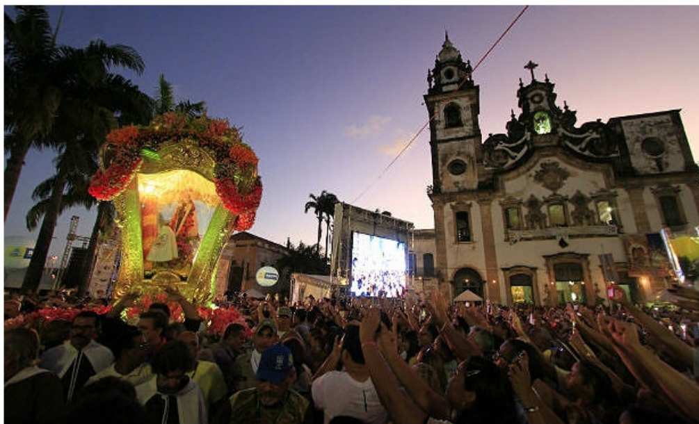
Serviços do Recife terão horário alterado por causa da festa em homenagem a Nossa Senhora do Carmo