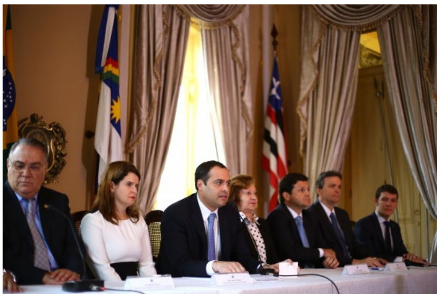
Apresentação dos resultados ocorreu nesta segunda-feira (20)

As condições especiais para pagamento de débitos tributários oferecidas pelo Mutirão da Negociação Fiscal de Pernambuco podem assegurar um retorno de cerca de R$ 90 milhões aos cofres públicos do Estado e do município do Recife. A iniciativa deu preferência a acordos cuja dívida é de até R$ 50 mil. No tocante ao Tesouro Estadual, devem ser regatados em 18 meses, mediante pagamento por parte dos devedores, R$ 27,2 milhões. Desse montante, R$ 1,79 milhão já foi liquidado, e, portanto, já está caixa.