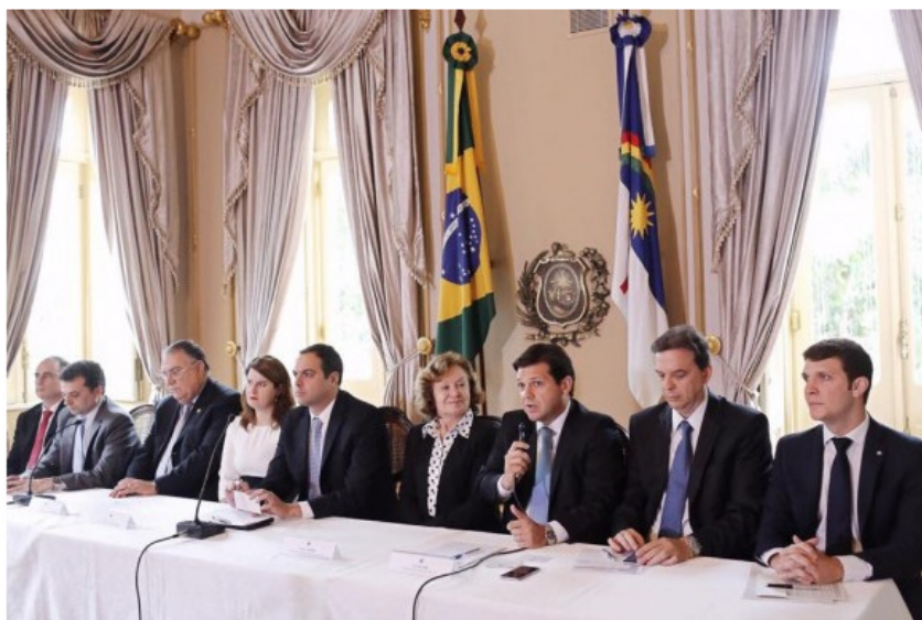
Reunião para apresentar balanço do mutirão fiscal.

O acerto nas contas dos contribuintes em débito com a Prefeitura do Recife resultou na arrecadação de mais de R$ 60 milhões. Já o Estado conseguiu reaver R$ 27,5 milhões em impostos atrasados. Iniciado no último dia 15, o Mutirão Fiscal – parceria entre o Tribunal de Justiça de Pernambuco, Prefeitura do Recife e Governo do Estado – segue até amanhã no Centro de Convenções, mas no Recife as condições de negociação serão prorrogadas até o dia 30 deste mês.